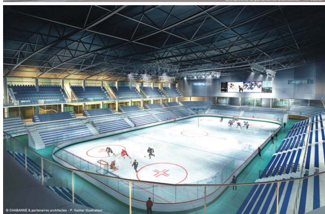
© CHABANNE & partenaires architectes - P. Vacher illustrateur