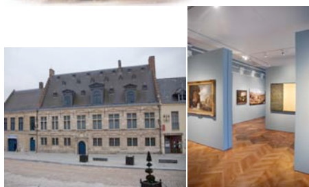
Musée départemental de Flandre