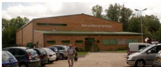
Maitrise d'ouvrage : Communauté d'Agglomération du Val d'Orge Architecte : Alain SALOTTI