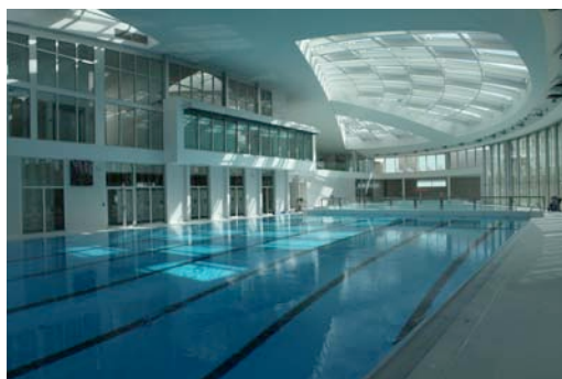
Maîtrise d'ouvrage : Ville de Vincennes Architecte : Pierre BOUDRY, BOUDRY ARCHITECTES