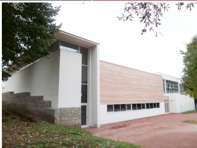
Maitrise d'ouvrage : Conseil Régional du Centre Architectes : Philippe COUTANT et Charles OLIVIERO

Philippe COUTANT, Agence SCPA COUTANT OLIVIERO