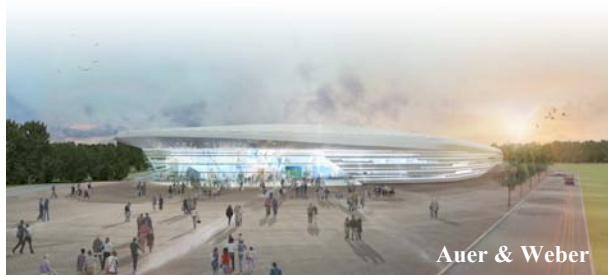
Auer & Weber

Maîtrise d'ouvrage : VILLE D'ANTIBES JUAN-LES-PINS Architectes : AUER & WEBER / FRADIN WECK