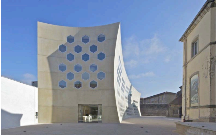
Maitrise d'ouvrage : Espace Communautaire Lons Agglomération Architectes : Agence DU BESSET-LYON / BEURET-RATEL Architectes

DU BESSET-LYON, Architectes Urbanistes BEURET-RATEL Architectes