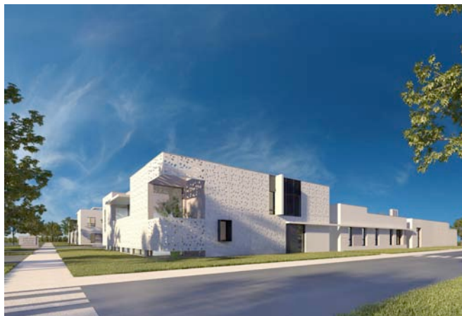
Maîtrise d'ouvrage : Centre Hospitalier de Châteauroux Architectes : Ivars & Ballet